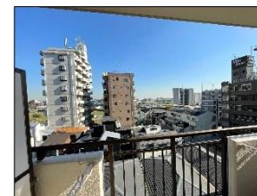
眺望も良好なお部屋です