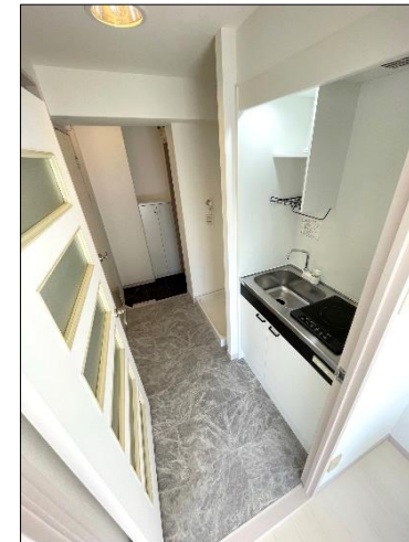
高級感のある大理石調のクッションフロア