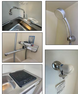
すべて新品に交換しました