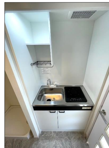
キッチンシンクも新設しております